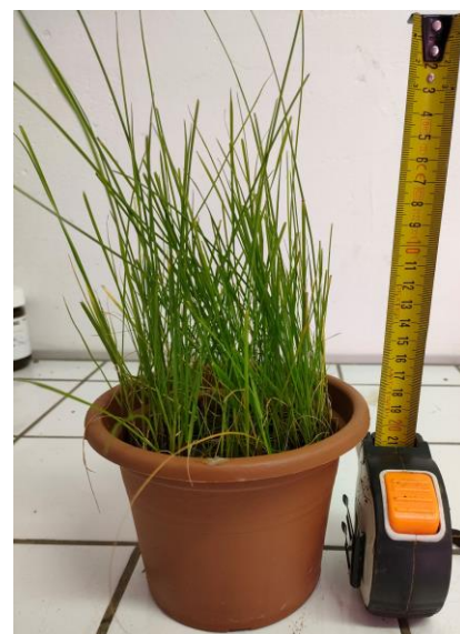
Photo après 6 semaines